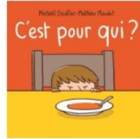
C'est pour qui ? Escoffier, Michaël (1970-....) L'école des loisirs 2018