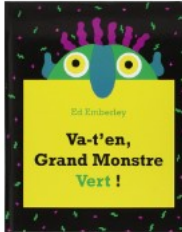
Va-t'en, Grand Monstre Vert ! Emberley, Ed Kaléidoscope 2006