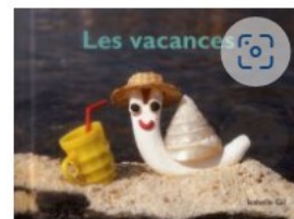
Isabelle Gil Ecole des Loisirs, 2014