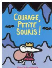
Michaël Escoffier Ecole des Loisirs, 2022