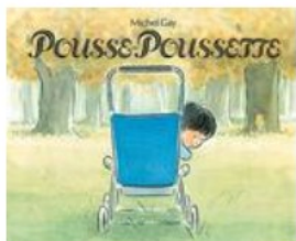
Michel Gay Ecole des Loisirs