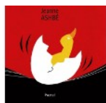
Jeanne Ashbé Ecole des Loisirs, 2019